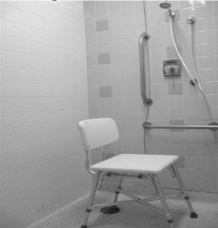
C. Siège de douche