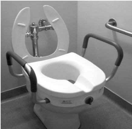
E. Siège de toilette surélevé avec appuie-bras