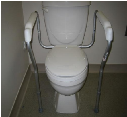
F. Cadre de sécurité pour la toilette