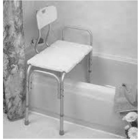
B. Banc de transfert