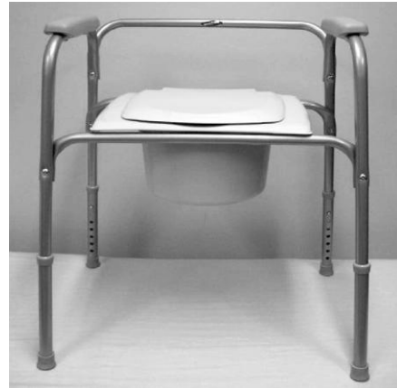
F. Siège d'aisance