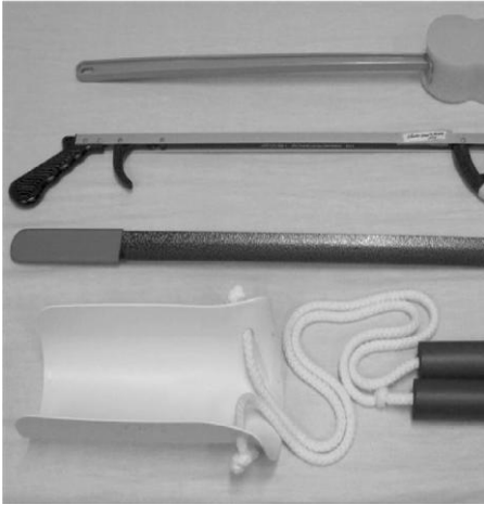
A. Éponge, pince, chausse-pied à manche long, et enfile-bas